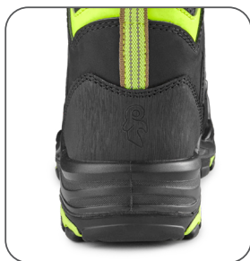
odolná pätní část odolná päťová časť resistant heel part wytrzymała część pięty